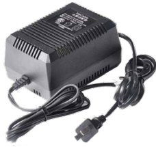
TEAC-66-243000V (EU) MKAC-66-243000U (USA) TEAC-66-243000VB (UK) Блок питания (модель для установки снаружи помещений)